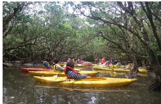
mangrove原生林でのカヌー体験