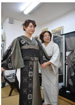
大島紬の 着付け体験