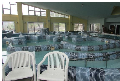
タラソ奄美の竜宮(奄美市)