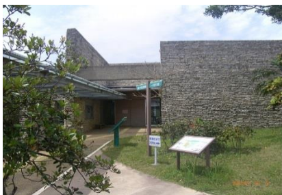
奄美パーク・田中一村記念美術館 (奄美市笠利町)