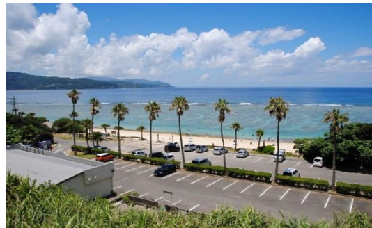
大浜海浜公園 (奄美市)