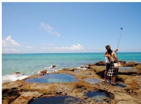
龍郷町赤尾木のハートロック