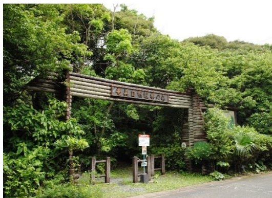
奄美自然観察の森入口(龍郷町)