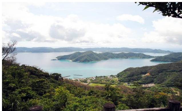
奄美自然観察の森・展望台から見た龍郷湾