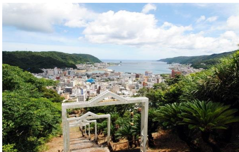
おがみ山から見た奄美市街地