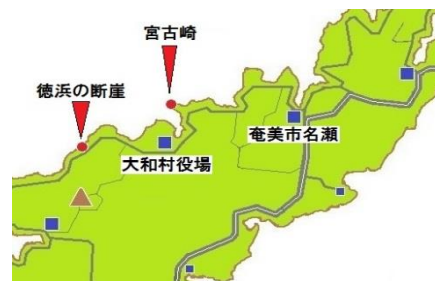
◀ リュウキュウチクが 広がる宮古崎 (大和村)