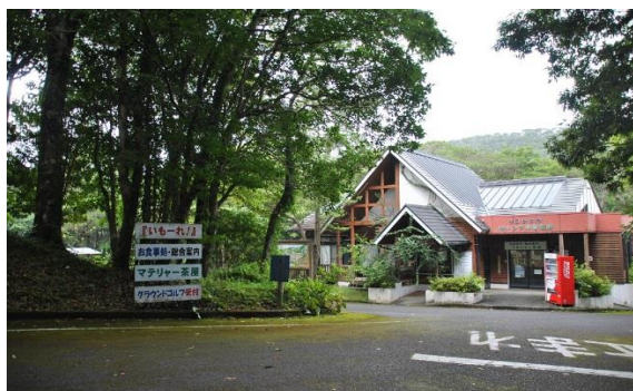
奄美フォレストポリス キャンプ場管理棟(大和村)