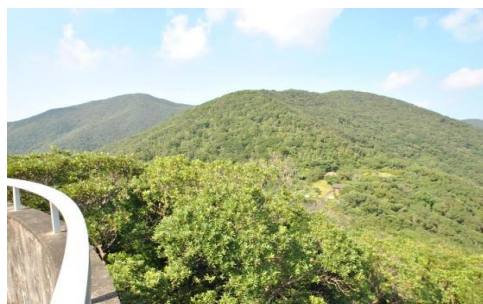
湯湾岳公園展望台からのながめ(宇検村)