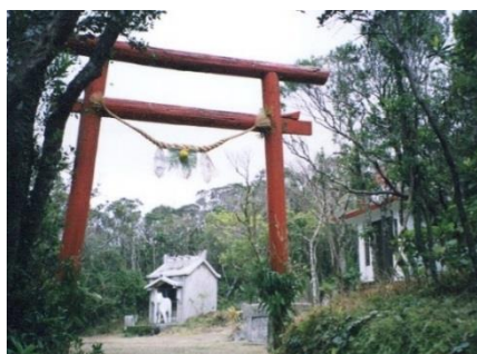
湯湾岳頂上近くにある広場