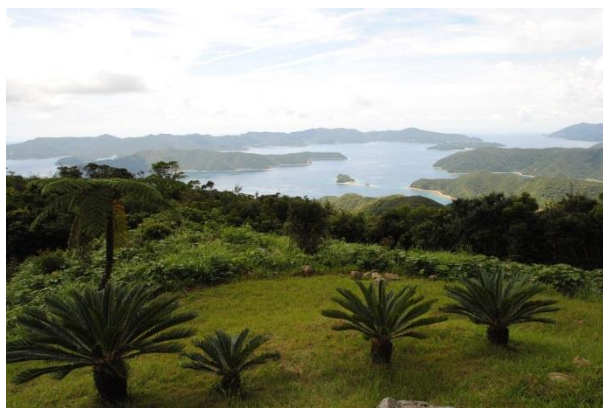
油井岳展望公園からの眺め