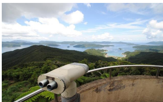
高知山展望所からの眺め (ともに瀬戸内町)