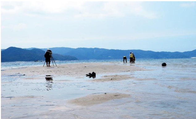
喜瀬のかくれ浜 (奄美市笠利町) (年に数日、現れる砂浜)