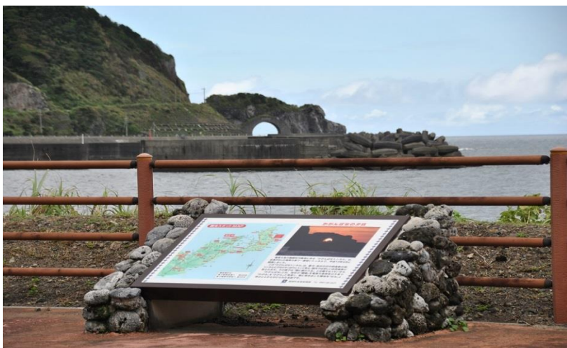
かがんばなトンネル (龍郷町) (年に数日、トンネルに夕日が入る 瞬間を見ることができる)