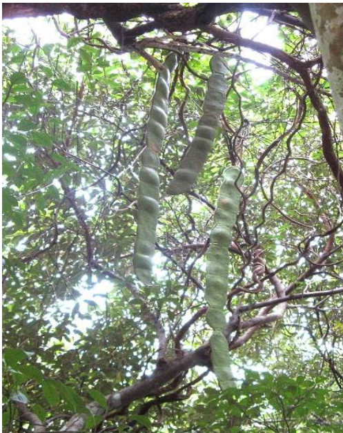
長さ1メートル近くにもなる 巨大な豆「モダマ」(奄美市住用町)