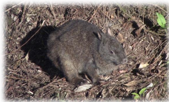
国の特別天然記念物、アマミノクロウサギ