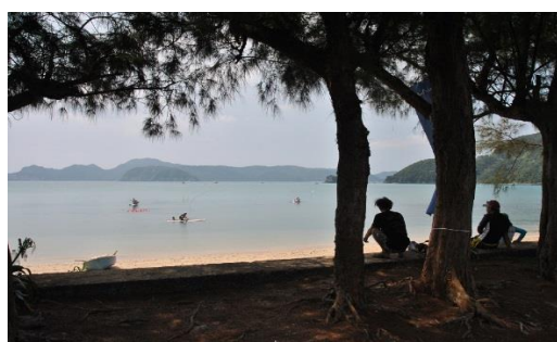
嘉鉄海岸(瀬戸内町)