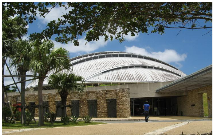
奄美パーク（奄美市笠利町）