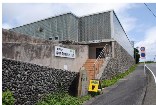
宇宿貝塚史跡公園 (ともに奄美市笠利町)