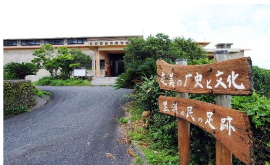
奄美市歴史民俗資料館