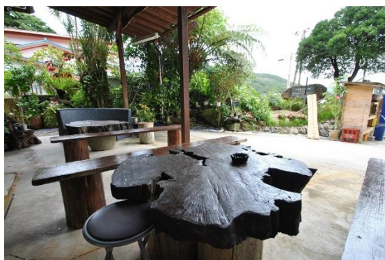
西郷松で作ったテーブル(休憩所)