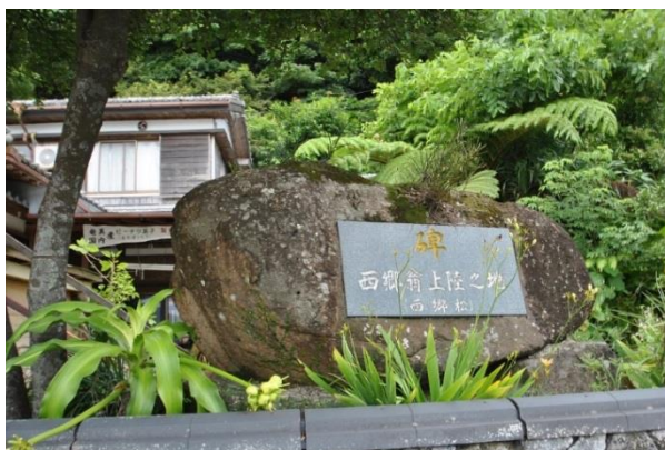
西郷翁上陸之地の石碑(西郷松跡) (ともに龍郷町)