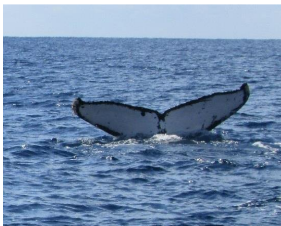
奄美大島近海でのホエールウォッチング

(物)は「奄美大島観光物産協会」会員 (観)は「奄美大島観光協会」会員 (エ)は「奄美大島エコツアーガイド連絡協議会」会員