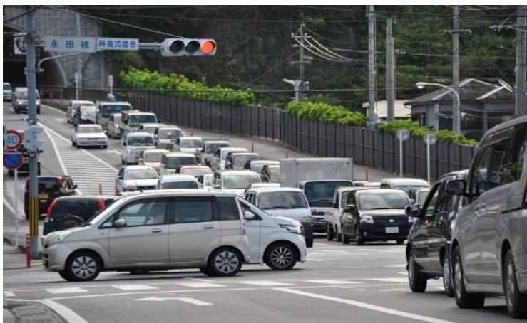
奄美市街地は交通渋滞になることもあります

◆奄美大島の主要道路を一周しようとすると、約250km。 ほとんどの道路が片側一車線で、カーブも多いため、車で6～7時間かかります。