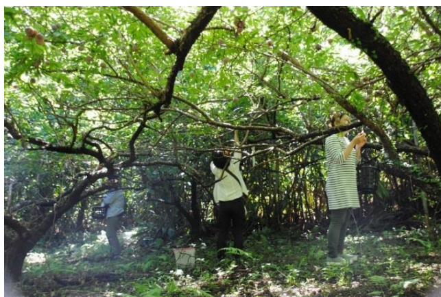
TAMASUのスモモ収穫体験