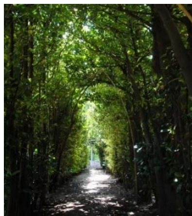
国直のフクギ並木(大和村)