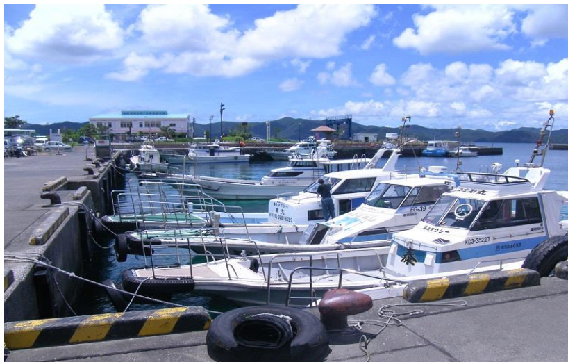
「海上タクシー」と呼ばれる 瀬渡し船 (瀬戸内町)