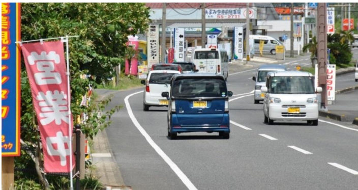
奄美空港前に並ぶレンタカー会社の看板(奄美市笠利町)