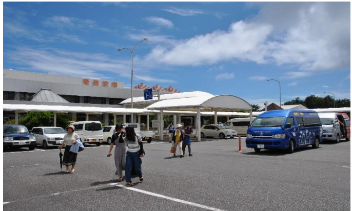
奄美空港の駐車場（奄美市笠利町）