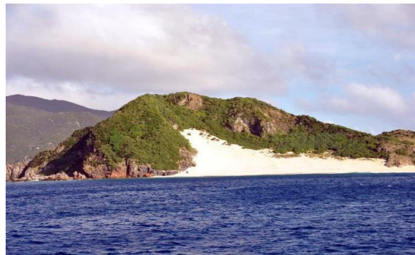
与路島と請島の 間にある無人島 ハマヤ島(瀬戸内町)