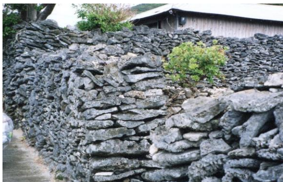
与路島のサンゴ石垣