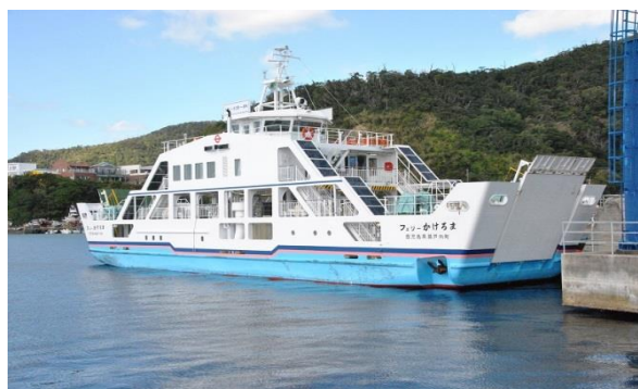
新しい瀬戸内町営「フェリーかけろま」197トン