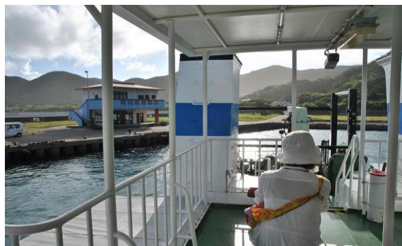
瀬戸内町営船「せとなみ」から見た与路島