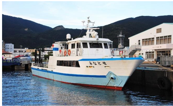
瀬戸内町営船「せとなみ」87トン

※瀬戸内町営「フェリーかけろま」は 2016年12月、新造船に代わった (194トン→197トン、旅客定員160人→140人)