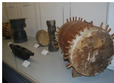
クサビ締め太鼓展