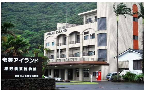
奄美アイランド外観 (奄美市住用町)